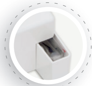
Compartiment pour accessoires intégré