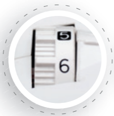
Pression du pied-de-biche et épaisseur du tissu