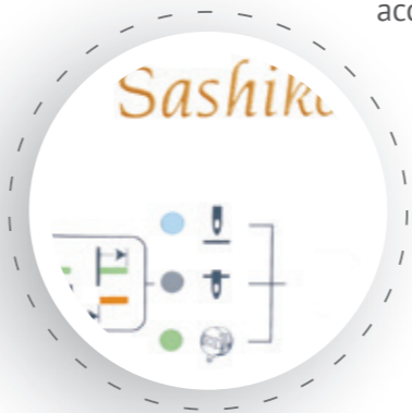
Touche de fonction pour aiguille position haute/basse