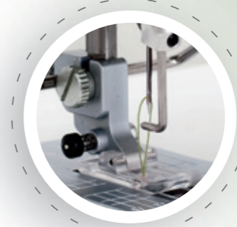
Système spécial d'alimentation du fil